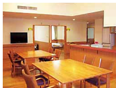
外断熱構造、吹き抜け天井、通年自然で快適な室温や明るい環境でお過ごし頂けます。