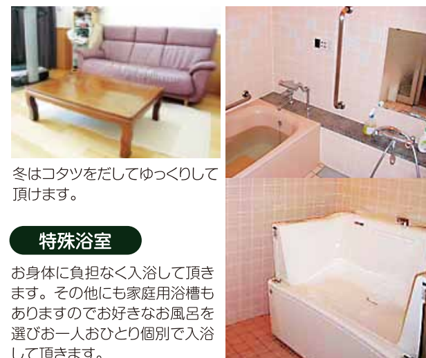
冬はコタツをだしてゆっくりして頂けます。