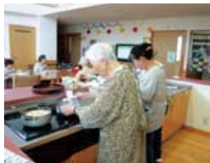
入居者の皆さまと一緒に食事を作ります。