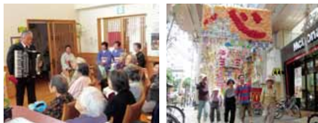
ボランティアの方が来て演奏会や歌を披露、ご利用者様も一緒に参加し楽しめます。また、年に数回外出行事も計画し様々な所へお出かけいたします。