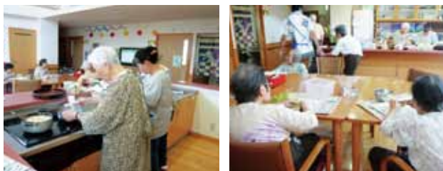
入居者の皆さまと一緒に食事を作ります。