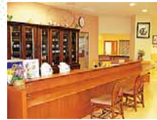
人気の喫茶コーナー